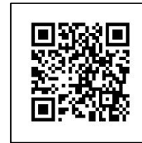
東西通路催事光景